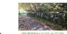
国道開削当時の石垣